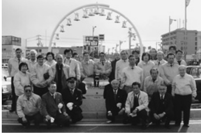
1. 新倉敷駅前カリヨン設置 12月14日(水)倉敷市へ寄贈