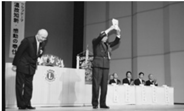
4. LCIF、CSF IIへ3,500ドル献金