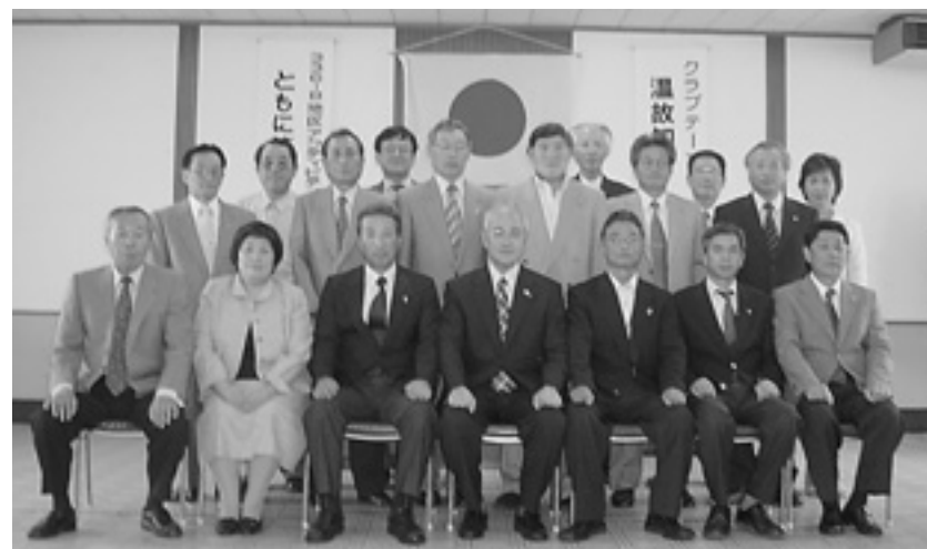
玉島ライオンズクラブ第50期役員