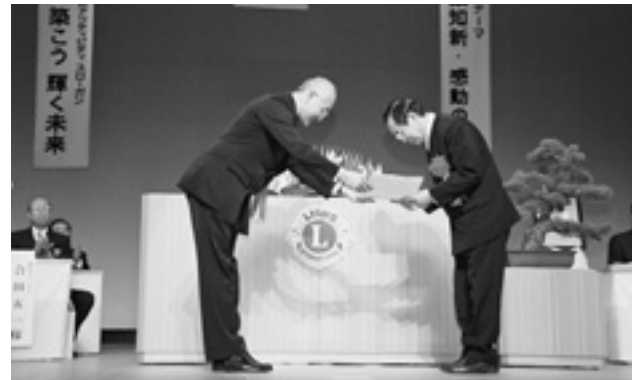
5. 倉敷地区保護司会玉島分会 金一封贈呈