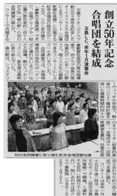
2005年9月27日(火) 山陽新聞朝刊掲載

9月25日 一般公募による認証50周年記念コンサート「森の歌」合唱団209名の結団式をくらしき作陽大学の125教室をお借りして挙行。結団式終了後、倉敷管弦楽団との初の合同練習を夕方まで行った。なお以後、1月の本番に向け11回の個別練習を実施している。